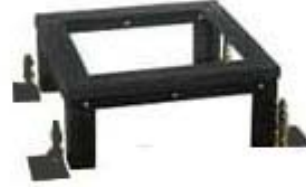
ジャッキアップベース式 M20ないしM22のボルト付きベースを用いて架台本体を突き立てて水平出しを細かく調整する事が可能。