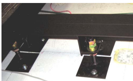
ジャッキアップベース方式固定脚例