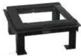
標準型四脚架台 一番オーソドックスな架台。大方のマシンルームに対応可能。