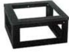
ダイス型チャンネルベース 四脚脚部がすべて補強されており頑丈です。